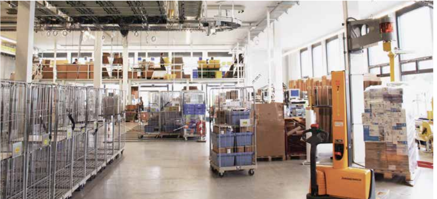
L'activité principale d' Ecomedia SA est la logistique de haute précision