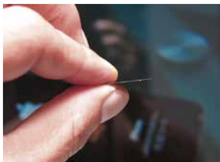
La SIM-chip T&N – un petit plus à grand effet

Transférer un appel de votre téléphone portable à un autre collaborateur, c'est vraiment possible? Oui, si l'installation téléphonique peut être gérée par commande DTMF en cours de conversation. Cela peut paraître quelque peu compliqué, mais vous n'avez à vous occuper de rien. Chez T&N, nos spécialistes s'y connaissent à la perfection et se feront un plaisir de vous conseiller.