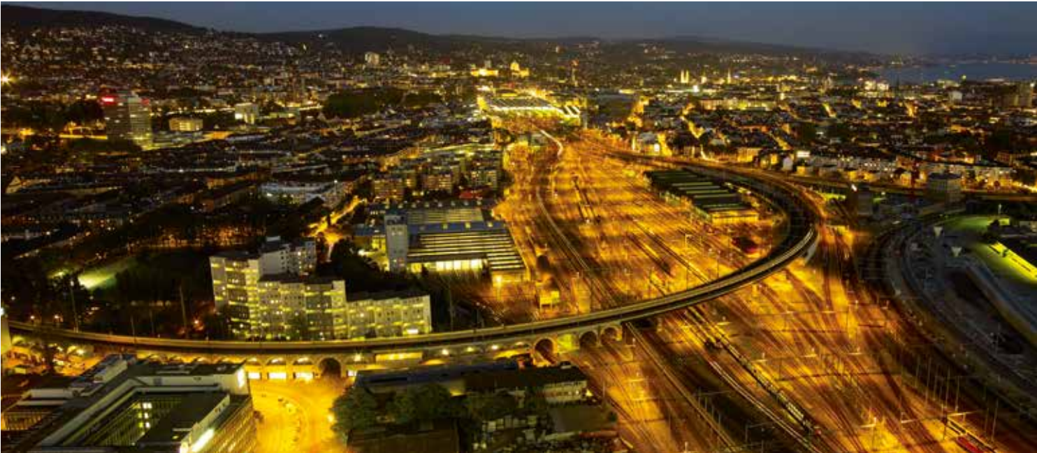
La vue nocturne imprenable sur la gare centrale de Zurich