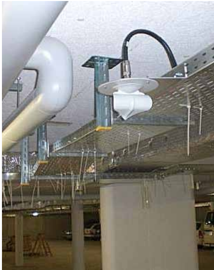
GSM/UMTS-Inhouse-Antennen gewährleisten die Versorgung in den hintersten Winkeln des Gebäudes.