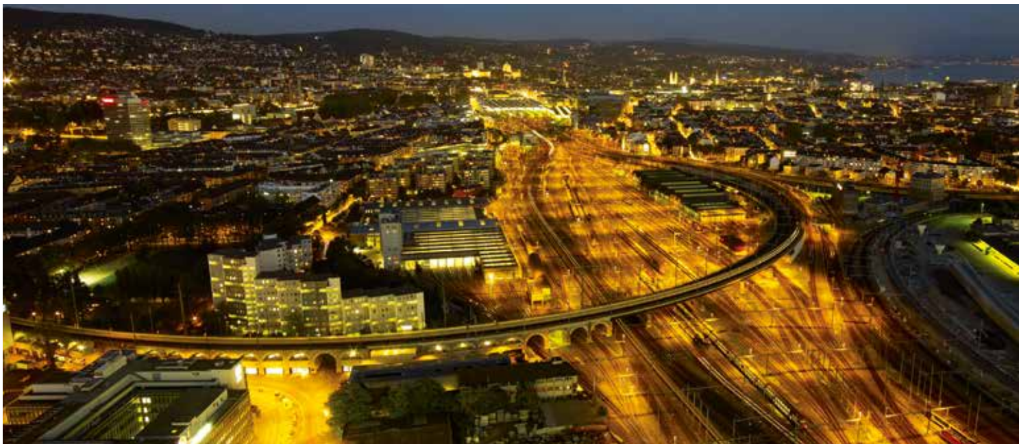
La vue nocturne imprenable sur la gare centrale de Zurich